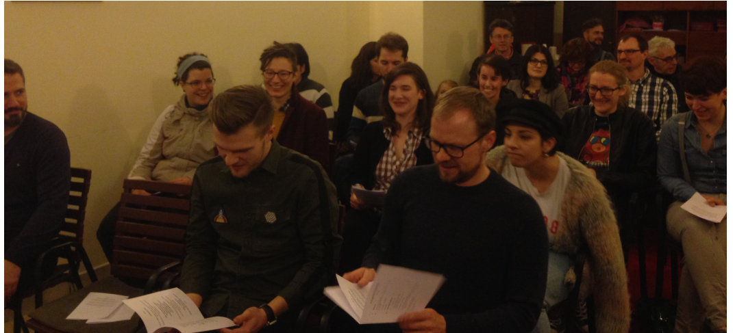
Posjet neprocjenjive grupe iz Zagreba

Kada radimo s ljudima, uvijek smatramo važnim razviti nove ideje, a također ih vidjeti kao organizam koji se mijenja i tvori nove oblike.