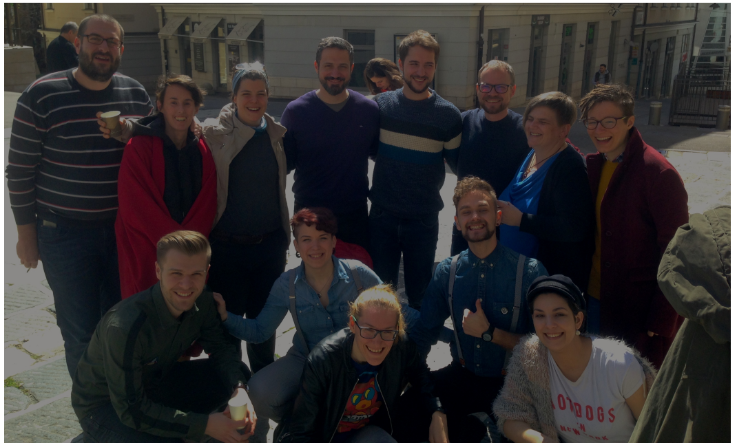
Naše neprocjenjive i neprocjenjivi