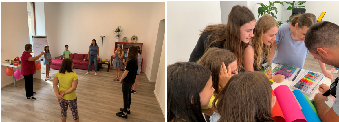
Primjer: fotografije snimljene za pretraživanje prikupljanja sredstava (ne objavljuju se zbog odobrenja)

Neda je pokrenula projekt za djevojčice i mlade žene u dobi od 12 do 18 godina. Program koji su razvili psiholozi u Nizozemskoj služi za osnaživanje djevojaka i njihovu podršku u njihovom razvoju. Iskustva pokazuju negativne utjecaje interneta, društvenih medija i stereotipnih uzora (model, pjevačica, glumica itd.) To dovodi do povećanog rizika od problema s mentalnim zdravljem kao što su depresija, poremećaji prehrane i nisko samopoštovanje. Djevojke se često osjećaju nesigurno i udaljeno od svoje obitelji. Doživljavaju odbijanje svoje dobne skupine. To je doba kada su u potrazi za vlastitim identitetom i postavljaju pitanja: Tko sam ja? Što bih mogla postati? Što ja zapravo želim?